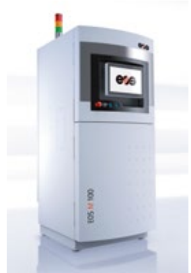
Extrem produktiv und effizient: EOS M 100

Für den Einstieg in die additive Herstellung von Zahnersatz sowie zur Erweiterung Ihrer Produktionskapazität bietet EOS Komplettlösungen aus einer Hand. Somit bieten wir volle Kontrolle über alle qualitätsrelevanten Prozesse und eine echte end-to-end-Lösung nach dem höchstmöglichen Standard (Zertifizierung nach Annex 2 der MDD 93/42/EWG).